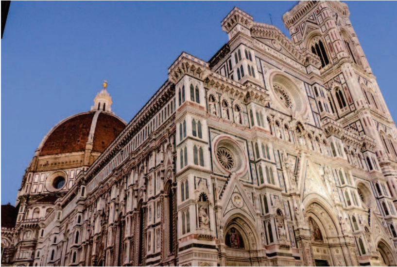
Cattedrale di Santa Maria del Fiore oftewel de Duomo van Florence, gebouwd vanaf 1296 en, na diverse onderbrekingen, voltooid door Filippo Brunelleschi in 1472.

1436, 140 jaar na het begin van de bouwwerkzaamheden, wijdde Paus Eugenius IV de Santa Maria del Fiore in, hoewel pas in 1472 met de voltooiing van de lantaarn boven op de koepel een einde aan de bouwwerkzaamheden kwam. Op dat moment was het de grootste kathedraal van Europa.