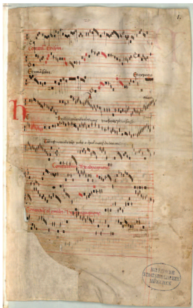
Fragment van een van Dufay's 14 chansons: He compagnons resveles , in een manuscript zonder titel. Mus.ms 3224 (Bayerische Staatsbibliothek München).

Op jonge leeftijd verhuisde hij samen met zijn moeder naar Kamerijk (Cambrai), vermoedelijk omdat een neef van Dufay's moeder daar kanunnik was. In Kamerijk dook zijn