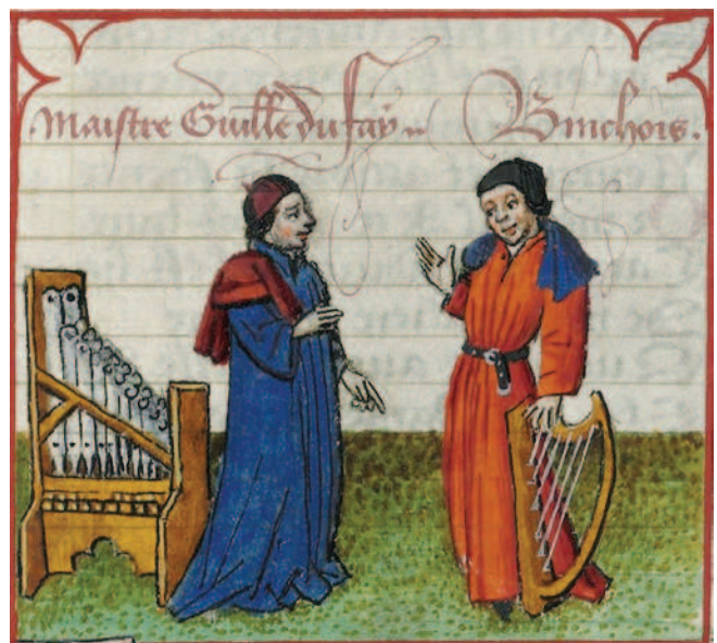
Guillaume Dufay (l) met orgel en Gilles Binchois met harp. Miniatuur in Champion des Dames van Martin de Franc, 1451.

Dit artikel opent met een korte beschrijving van het hertogdom Bourgondië en de importantie van dit huis voor de muziek, gevolgd door een levensbeschrijving van Dufay. Ik licht uit zijn oeuvre drie composities die tot de bekendere werken behoren, waarbij ik ook de vraag stel hoe bekend deze componist eigenlijk is. Door bij deze componist stil te staan is er geen ontkomen aan om tenslotte een beschrijving van de fauxbourdon-stijl op te nemen, een stijl waarmee een nieuwe klank ontstond.